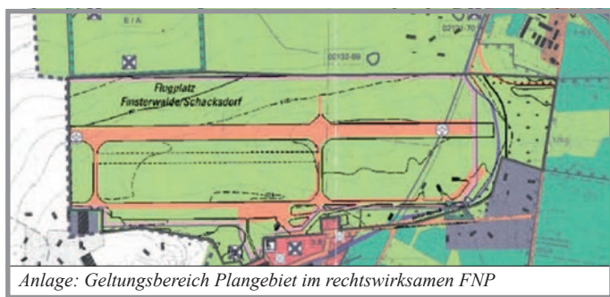
Anlage: Geltungsbereich Plangebiet im rechtswirksamen FNP