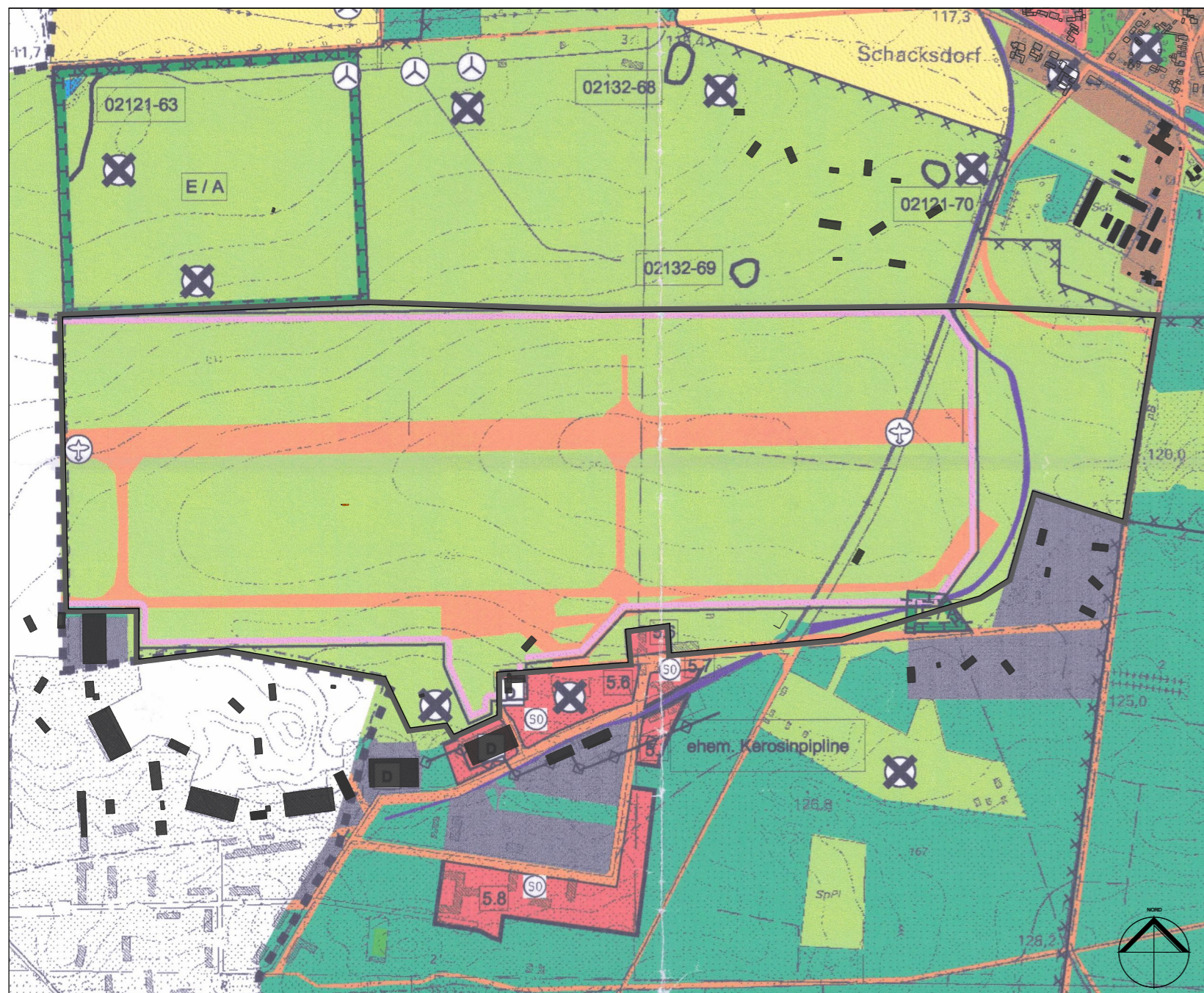
rechtswirksamer Flächennutzungsplan des Amtes Kleine Elster